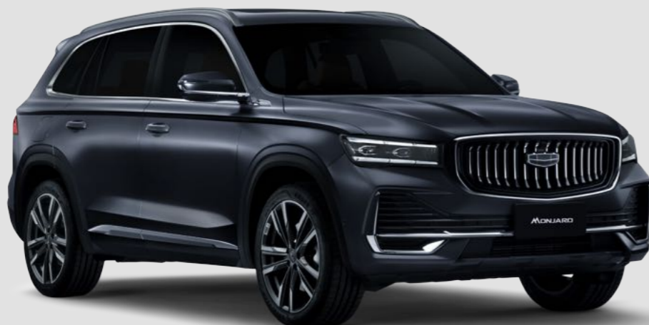
Серый матовый Lomo Grey