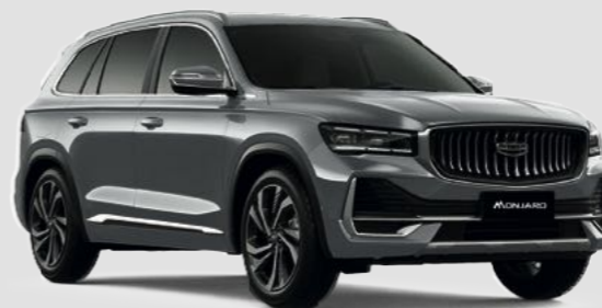
Серебристый металлик Aurora Silver