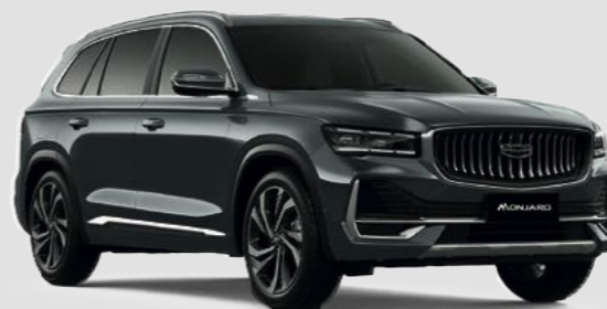
Серый металлик Basalt Grey