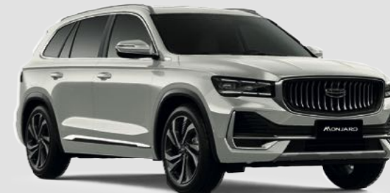
Белый металлик Oyster White